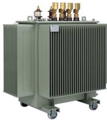
Řada 50 až 2500 kVA